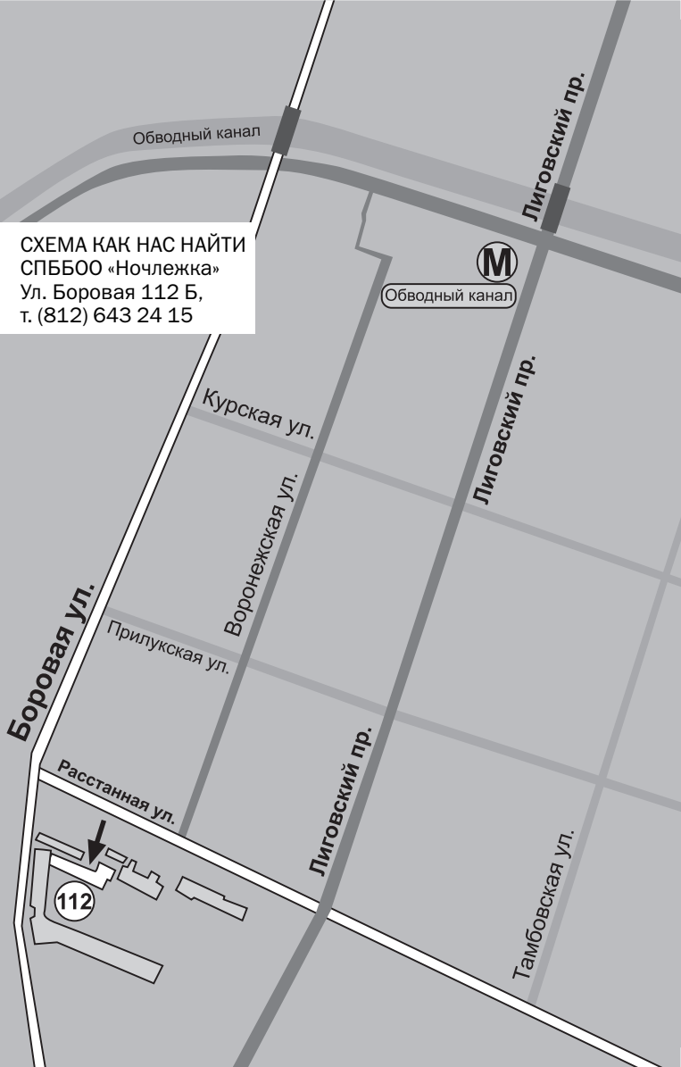
СХЕМА КАК НАС НАЙТИ СПББОУ «Ночлежка» Ул. Боровая 112 Б, т. (812) 643 24 15